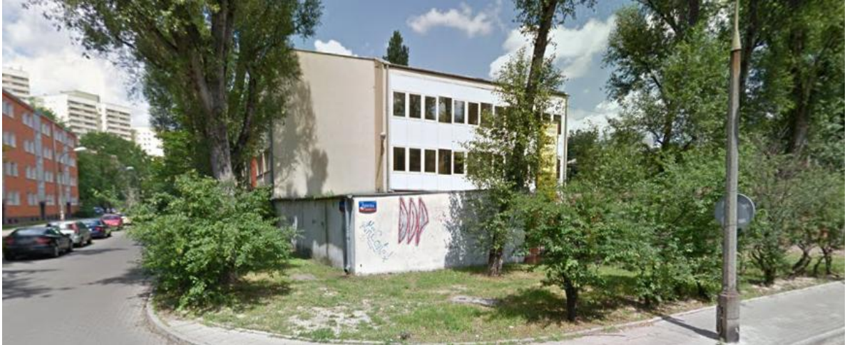
Widok nieruchomości od strony ul. Darłowskiej róg Zgierskiej