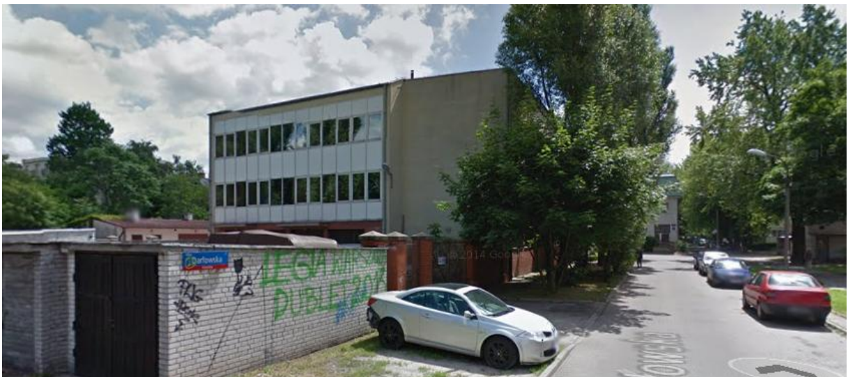
Widok nieruchomości od strony ul. Darłowskiej róg Kutnowskiej