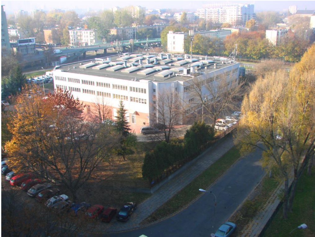
Widok budynku biurowego od strony al. Stanów Zjednoczonych