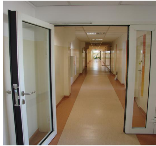
Widok klatki schodowej w budynku biurowym